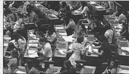
Η πρόεδρος της Βουλής Άννα Μπενάκη - Ψωφίδα θα υποδεχτεί τους έφηβους βουλευτές

συζητούν οι Επιτροπές, αντίστοιχες των Διαρκών Επιτροπών της Βουλής των Ελλήνων και θα συμμετάσχουν σε προγραμματισμένες πολιτιστικές δραστηριότητες όπως ξεναγήσεις σε αρχαιολογικούς χώρους.