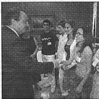
Ο Πρωθυπουργός Κώστας Καραμανλής σμέως μετά την συνάντηση που είχε στο γραφείο του με αντιπροσωπεία της Βουλής των Εφήβων δήλωσε εντυπωσιασμένος από το επίπεδο σκέψης των μικρών πολιτικών

τικών Υποθέσεων Μαρία Μαθθίνα Γεωργίου από το Ναύπλιο ήταν όμως που έλεγε την παράσταση παραδίδοντας απλόχερα μαθήματα ανθρωπιάς. Η αναφορά της στον θάνατο του μικρού Δημήτρη στο Ωνάσειο επειδή δεν βρέθηκε μόσχευμα και τα όσα είχε να πει για εκείνους που υποκριτικά έδειξαν ότι νοιάζονται προκάλεσε τα παρατεταμένα χειροκροτήματα των συναδέλφων της. Όπως είχε, το παιδί αυτό θα συναντήσει και άλλα στη γεγονιά των αγέλων, που "φεύγοντας" κατάφεραν να "ρηθίσουν" ζωή πίσω τους προσφέροντας ζωτικά όργανα. "Δύο ημέρες κράτισε ο θρήνος στις τηλεοράσεις, συγγμίοις όπως και η υποκρισία. Συγκεκριμένοι πολιτικοί, όπως ο Καζαλανής, ο Σημίτης, η