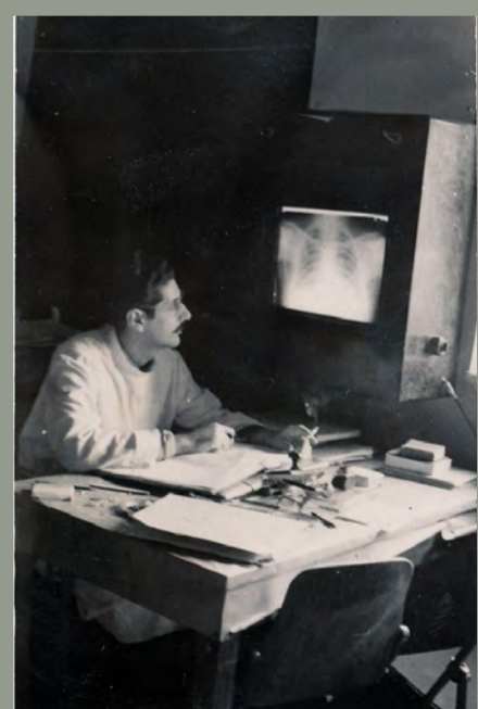
Στο Ακτινολογικό Εργαστήριο του Νοσηλευτικού Ίδρυματος του Μετοχικού Ταμείου Στρατού (Ν.Ι.Μ.Τ.Σ.), 1952