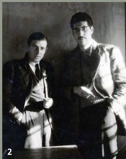
Φωτ. 1 & 2: Αμέσως μετά την αποφυλάκιση του τον Δεκέμβριο του 1950 Αρχείο του ποιητή