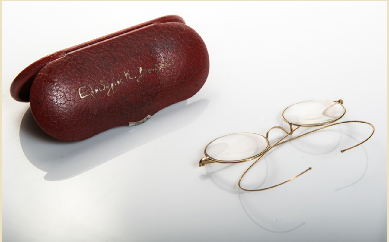
Τα γυαλιά του Ελευθερίου Βενιζέλου