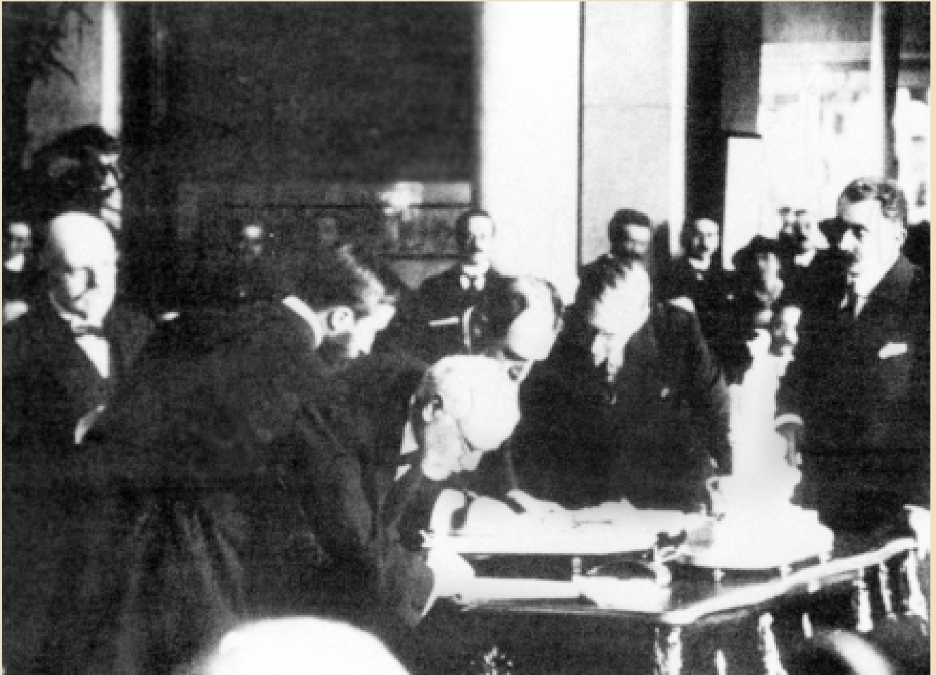
Ο Ελευθέριος Βενιζέλος υπογράφει τη Συνθήκη των Σεβρών, 1920