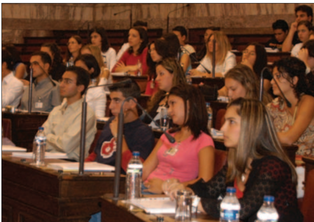
«Έφηβοι Βουλευτές» στις συνεδριάσεις των Επιτροπών της «Βουλής των Εφήβων».