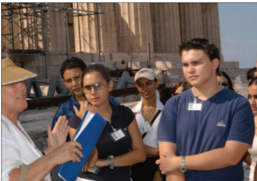
«Εφηβοι Βουλευτές» ξεναγούνται στα μνημεία της Ακρόπολης.