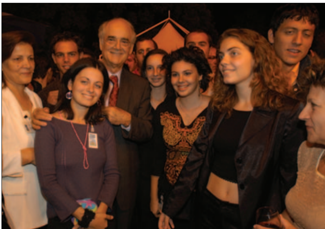
Ο Πρόεδρος της Βουλής κ. Απόστολος Κακλαμάνης ανάμεσα σε νέους και παλαιούς «Εφήβους Βουλευτές» στη δεξίωση που δόθηκε προς τιμήν τους στο προαύλιο του κτιρίου του Κοινοβουλίου.