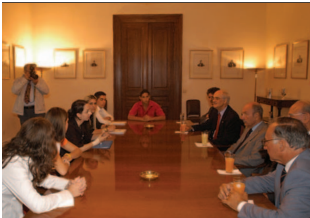
Στιγμιότυπα από την επίσκεψη των εισηγητών των Επιτροπών της «Βουλής των Εφήβων» στον Πρόεδρο της Δημοκρατίας κ. Κωνσταντίνο Στεφανόπουλο.