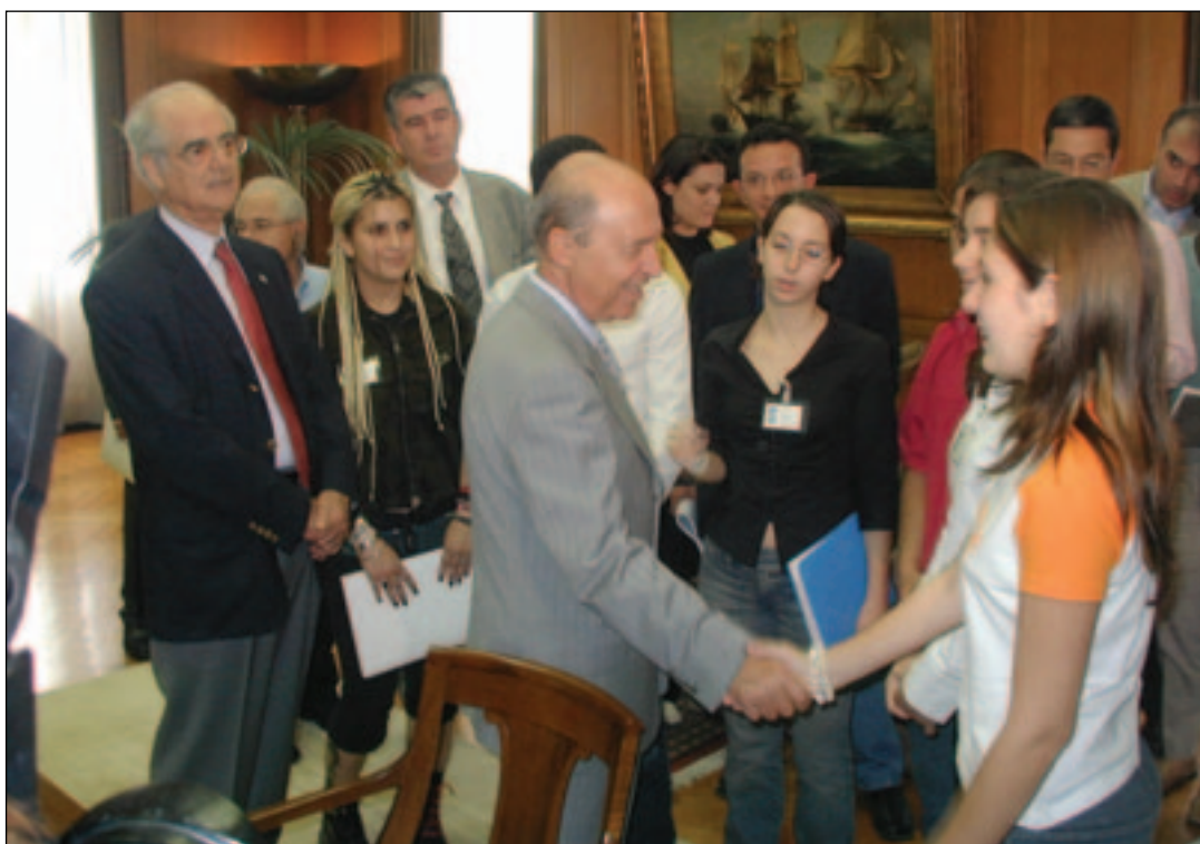
Ο Πρωθυπουργός κ. Κώστας Σημίτης συγχαίρει τους εισηγητές των Επιτροπών της «Βουλής των Εφήβων» παρουσία του Προέδρου της Βουλής των Ελλήνων κ. Απόστολου Κακλαμάνη.