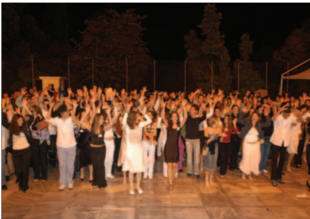
Χαρούμενο στιγμιότυπο από τη δεξίωση που δόθηκε προς τιμήν των «Εφήβων Βουλευτών» της Η΄ Συνόδου στο προαύλιο του κτιρίου του Κοινοβουλίου.