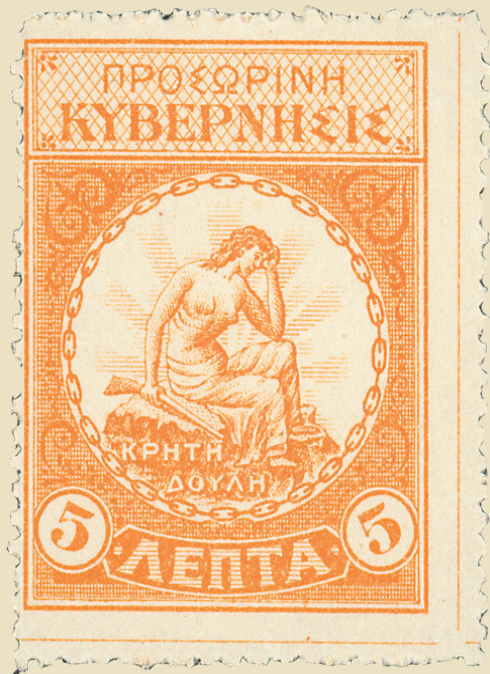
Stamps of the Revolutionary Government of Therisso