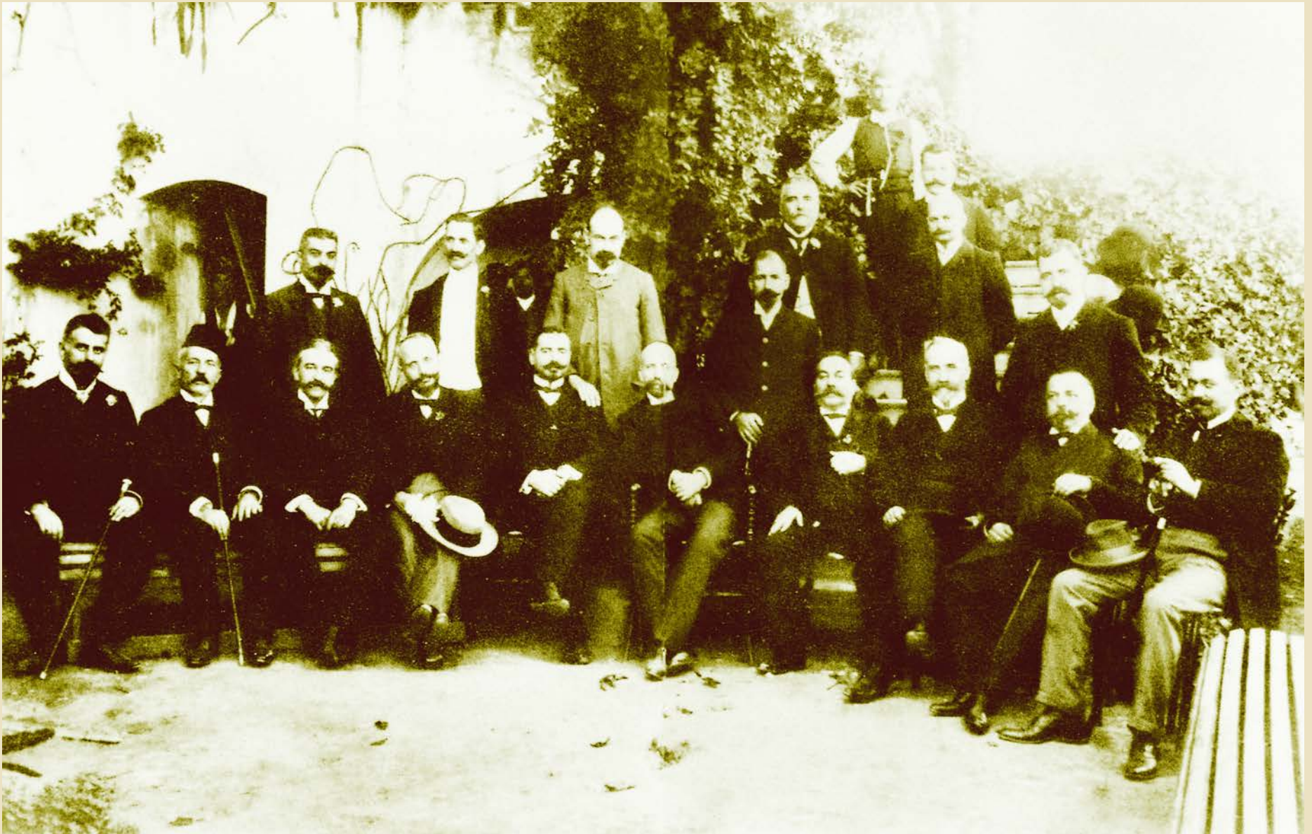
The Committee for drafting the second Constitution of the Cretan State, 1906-1907. Among the representatives, Eleftherios Venizelos, who was responsible for its fundamental provisions