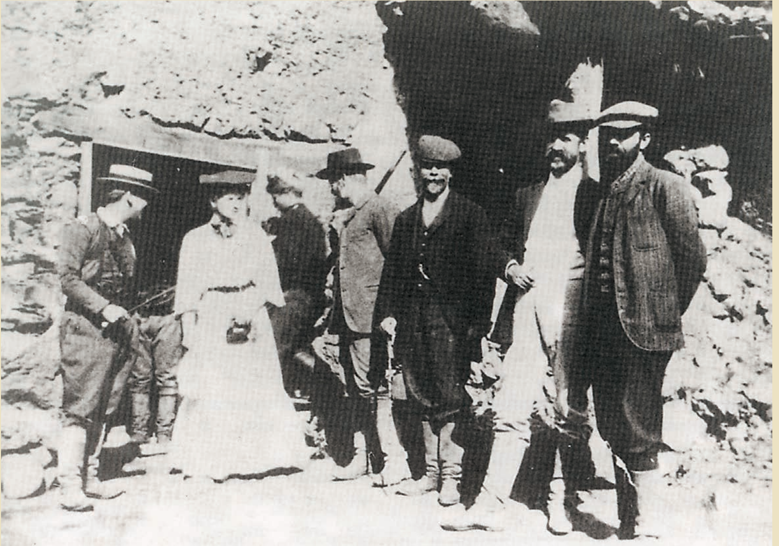
Venizelos with revolutionaries and a representative of the foreign press in Therisso