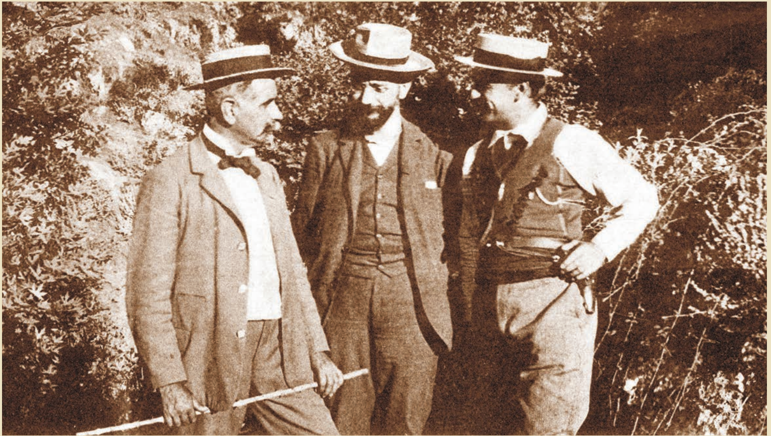
The triumvirate of Therisso K. Foumis, El. Venizelos and K. Manos