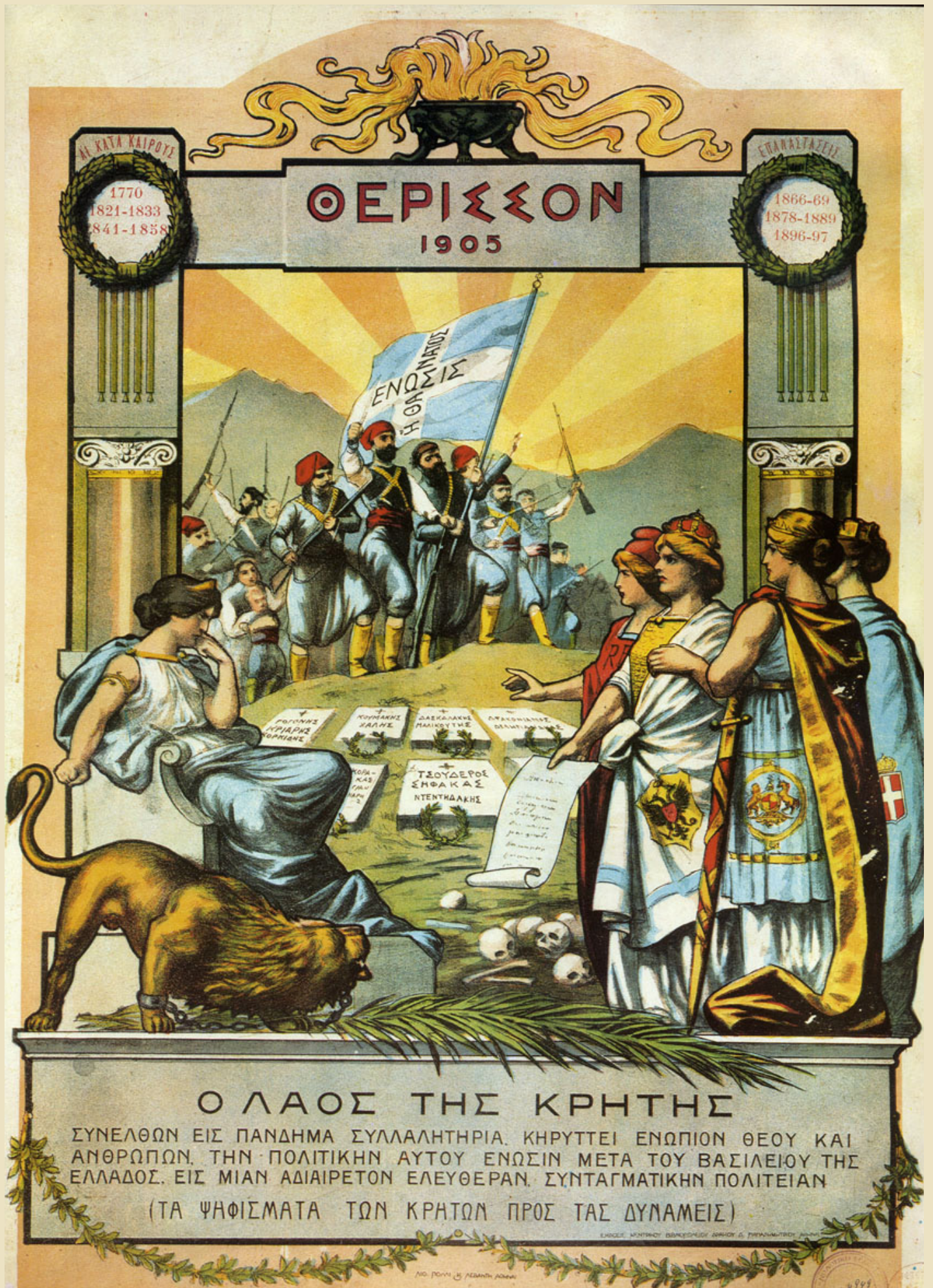
Lithograph depicting the popular request of the revolution of Therisso for the unification of Crete with Greece