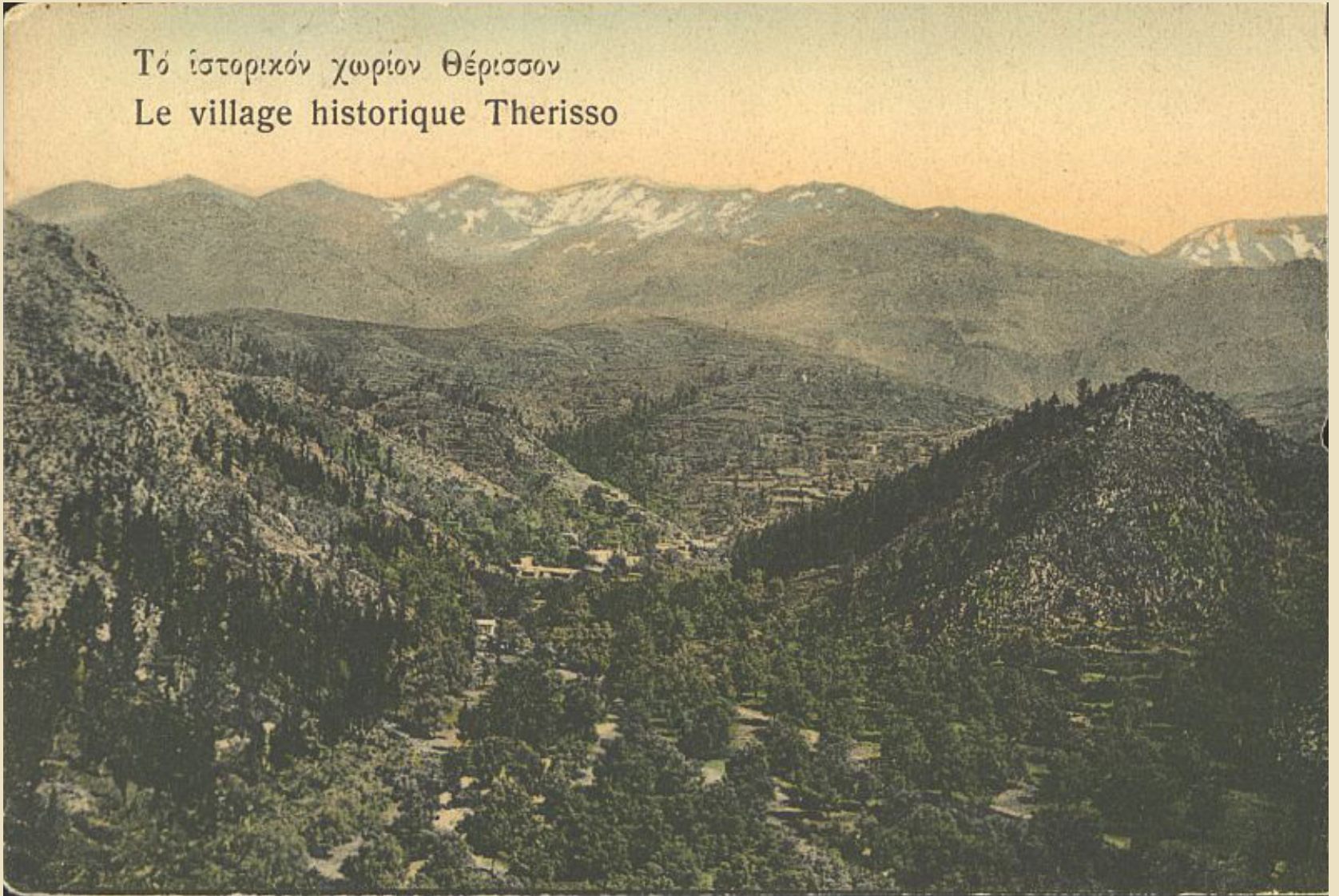
Postcard from the early 19th century depicting Therisso

Τό ιστορικό χωρίον Θέρισσον Le village historique Therisso