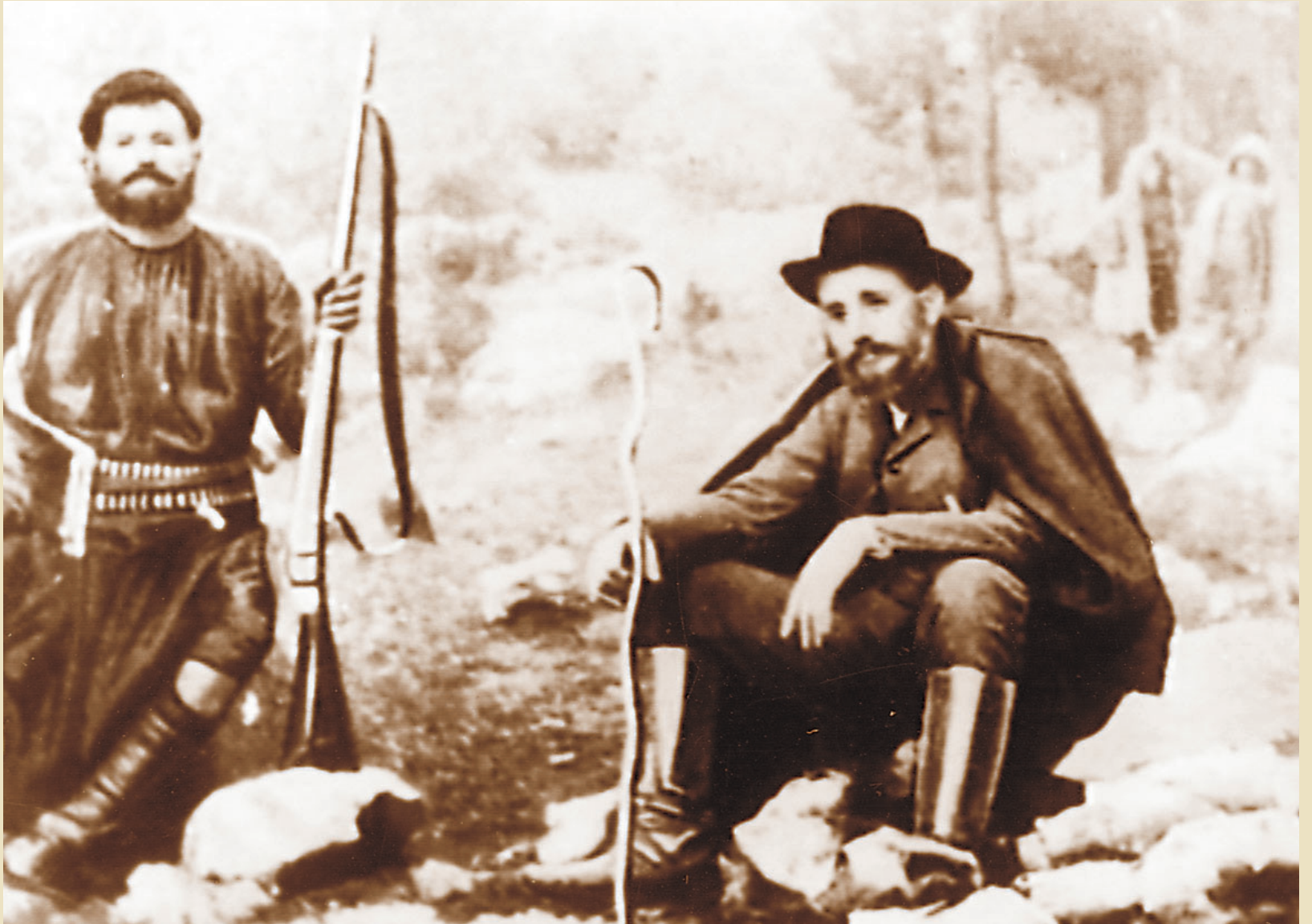
Eleftherios Venizelos in Therisso