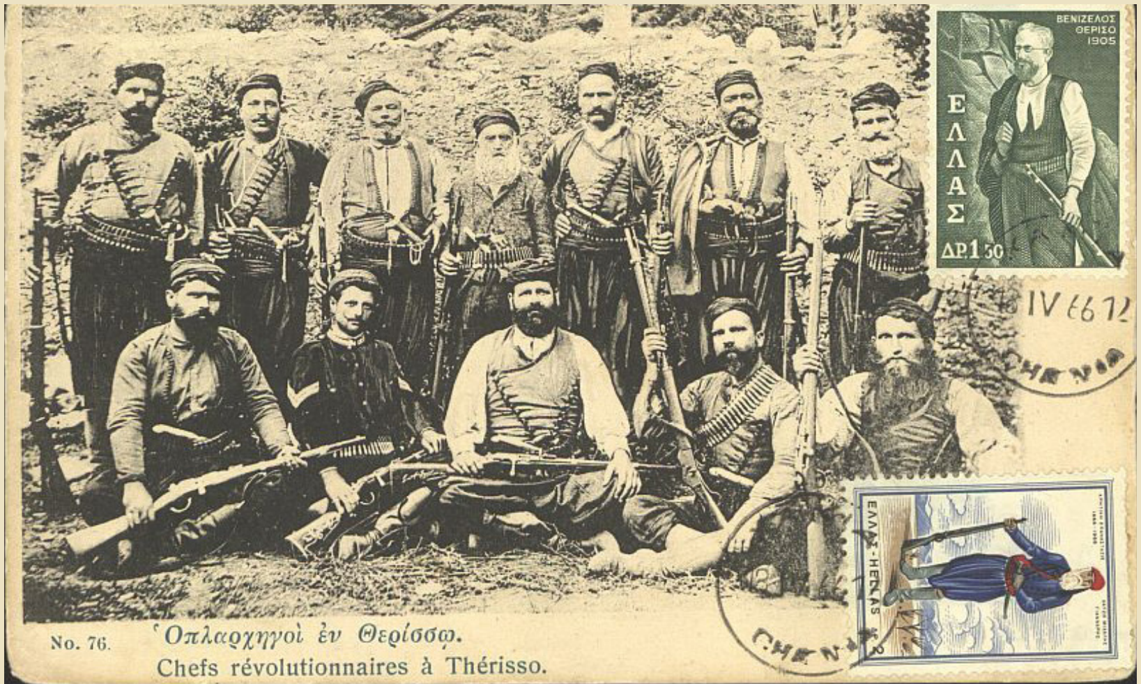
Postcard from the early 19th century depicting the army leaders of Therisso bearing posterior commemorative stamps