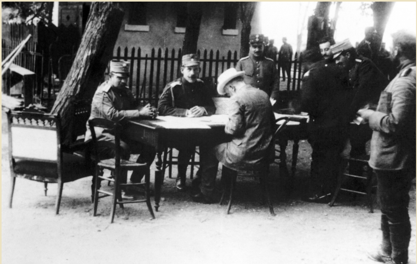
Venizelos on the front with King Constantine during the second Balkan War