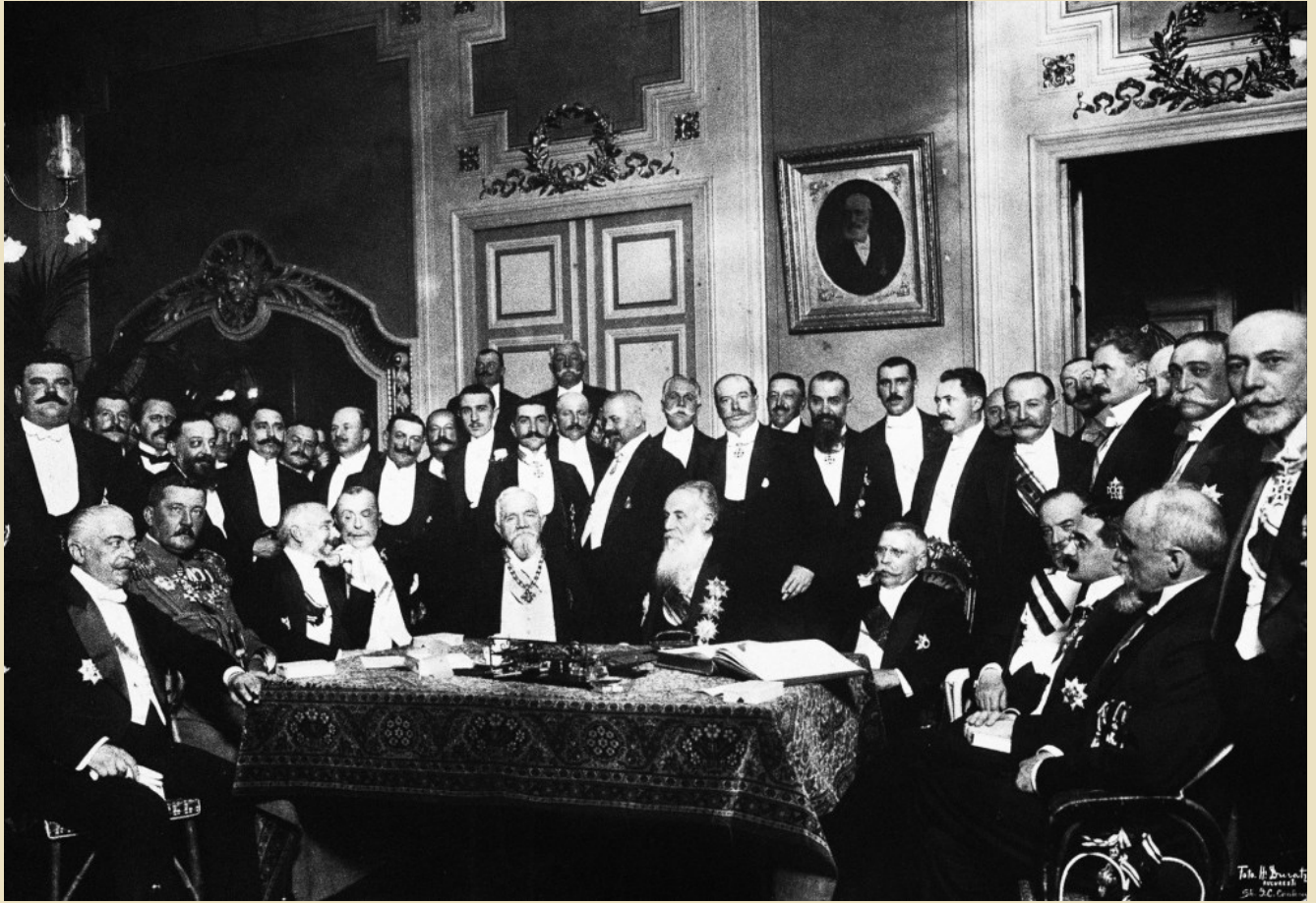
Eleftherios Venizelos with the leaders and representatives of the Balkan countries when signing the Treaty of Bucharest, 1913