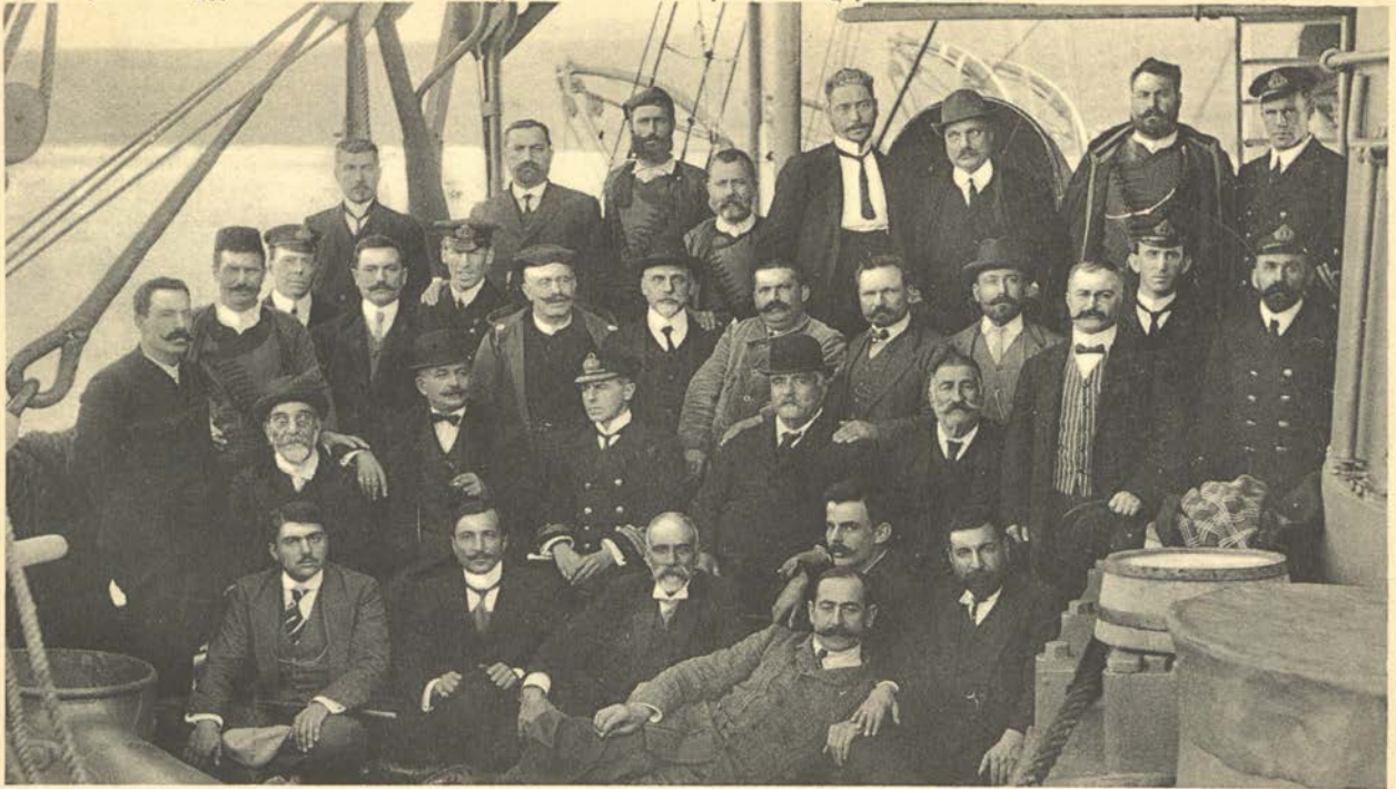
Les Deputés Crètois gardés sur les vapeurs de guerre Européens en 1911,