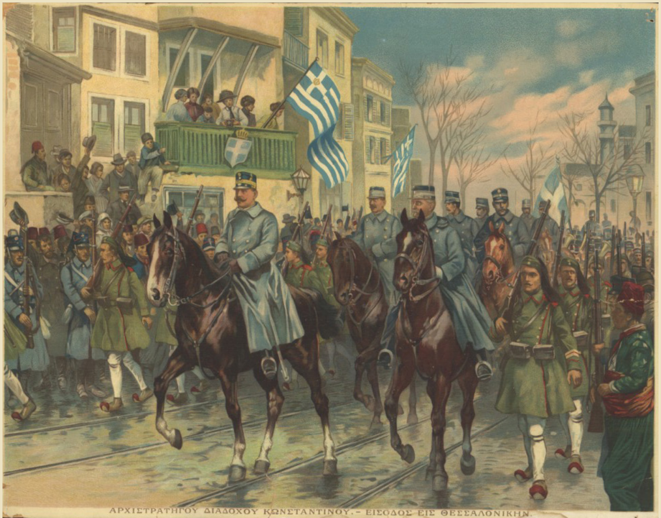
The entrance of the successor of the throne, Constantine in Thessaloniki, October 26th, 1912