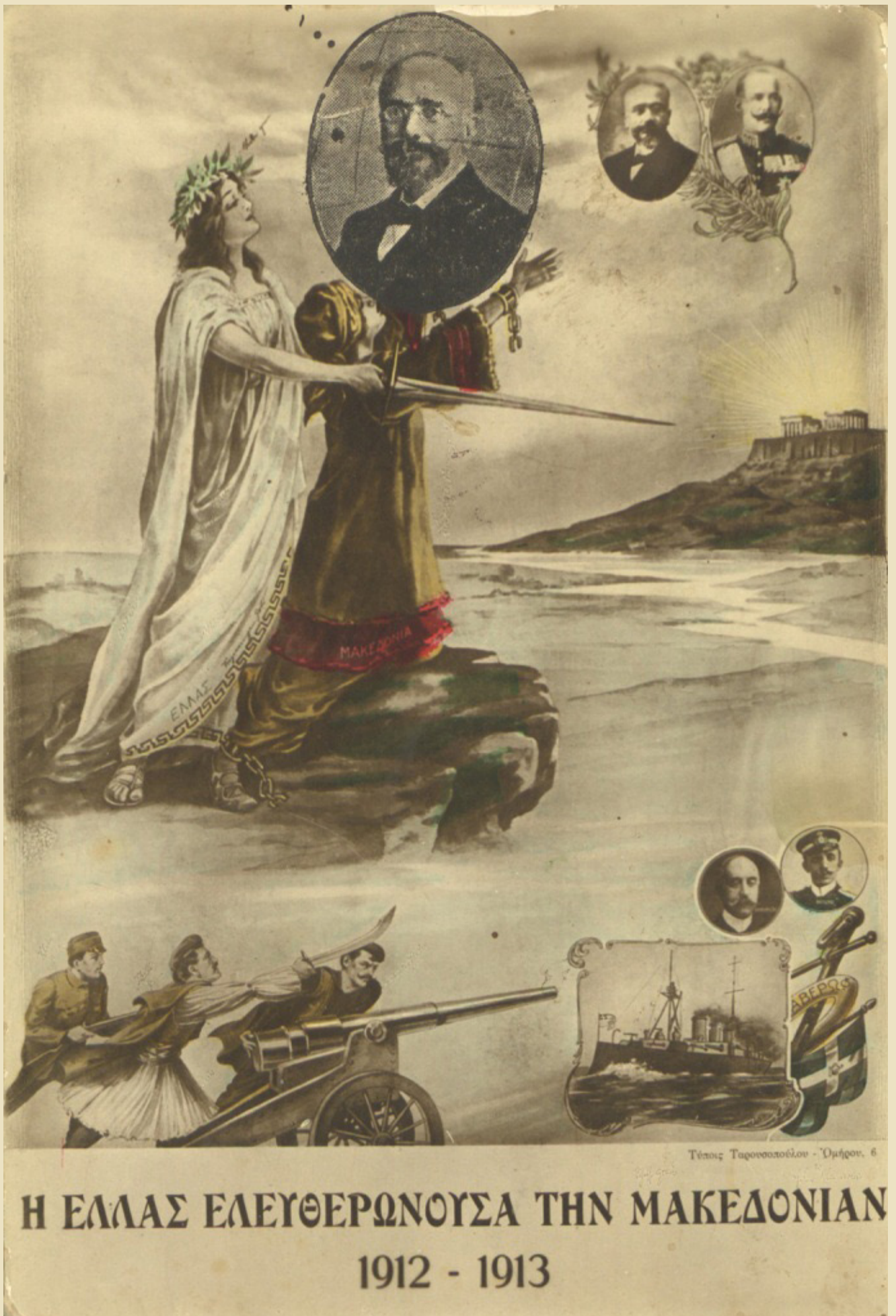
Postcard on the great victory of the Greek army