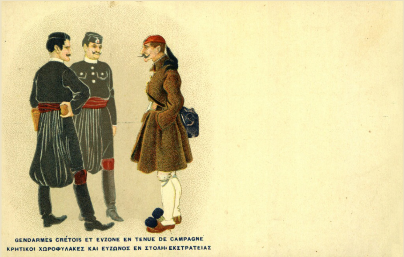
Postcard of the time with Cretan gendarmes and Evzone