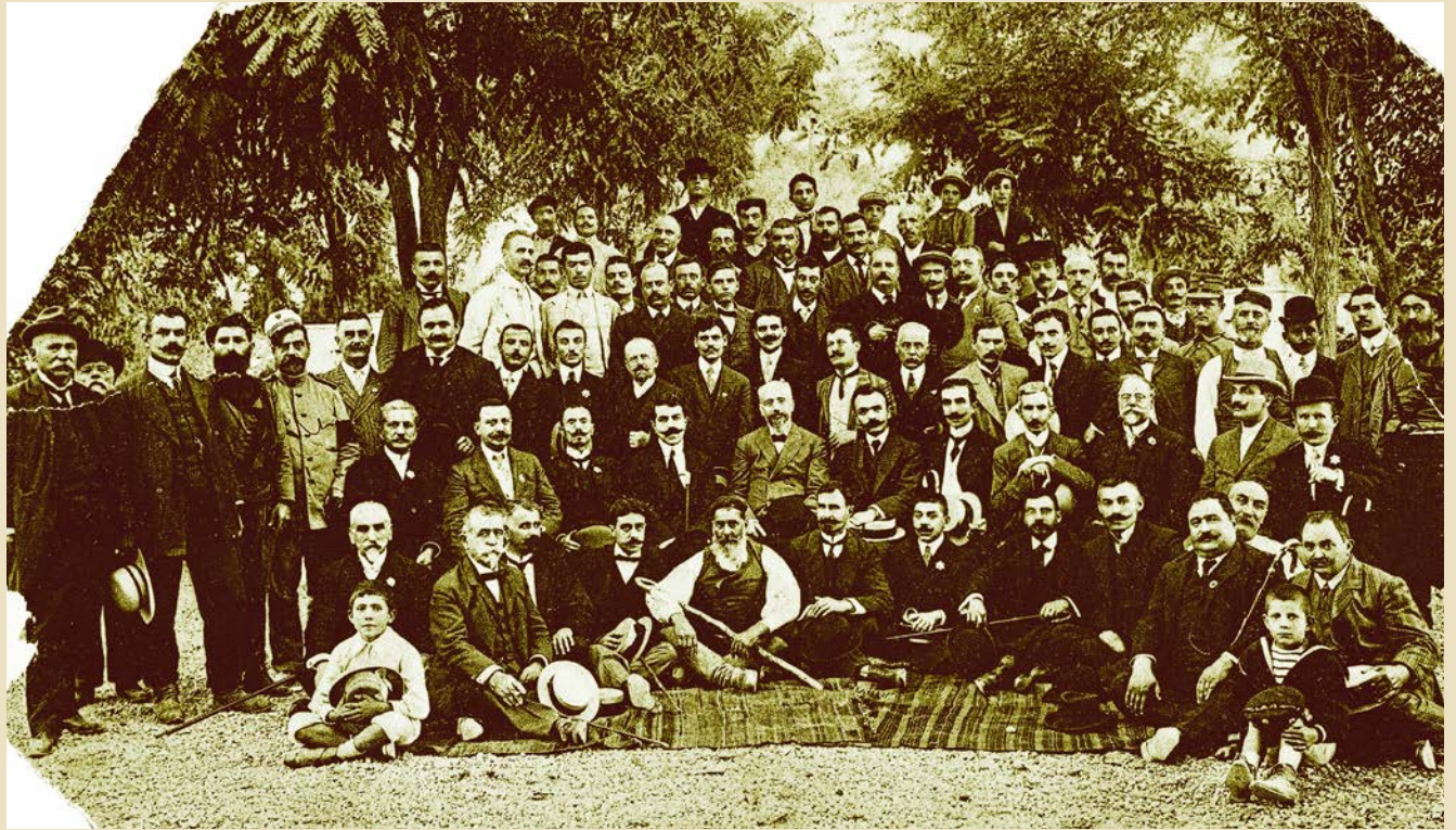
Farewell gathering in honor of Eleftherios Venizelos in the Public Garden of Chania, following his appointment as Prime Minister of Greece on October 6th, 1910