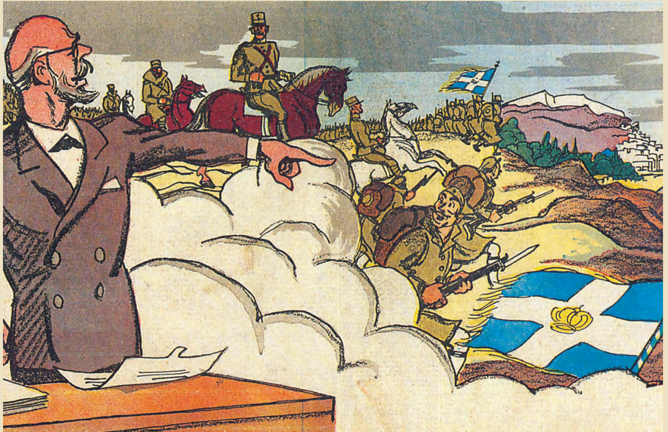
Lithograph of the period depicting Eleftherios Venizelos, Constantine and the Greek army