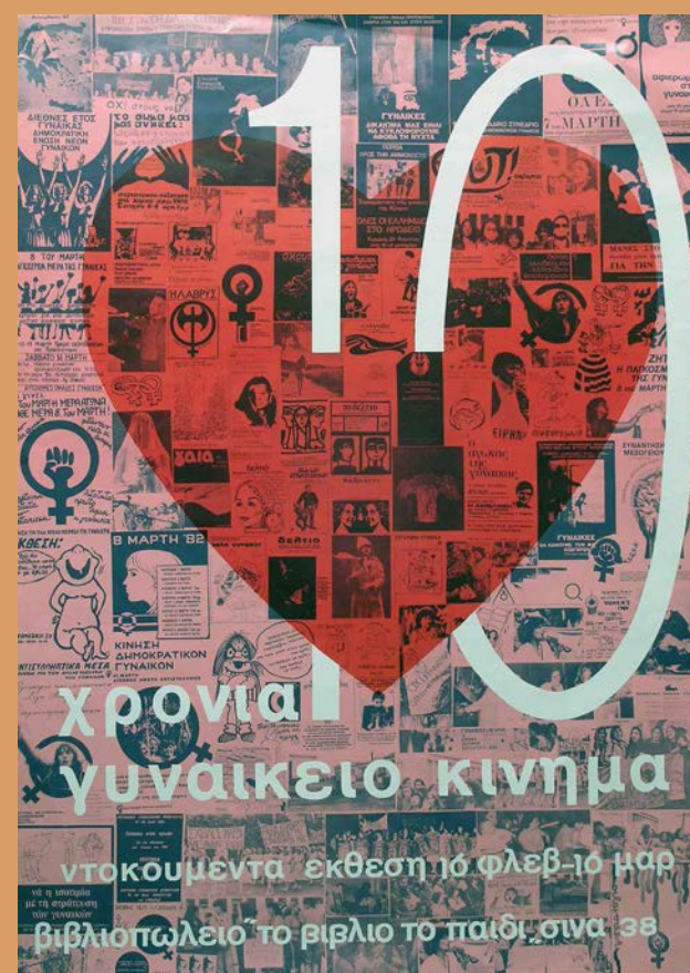
Αφίσα της έκθεσης «10 χρόνια Γυναικείο Κίνημα» στο βιβλιοπωλείο «Το βιβλίο/Το παιδί» Αρχείο Γυναικών «Δελφύς»