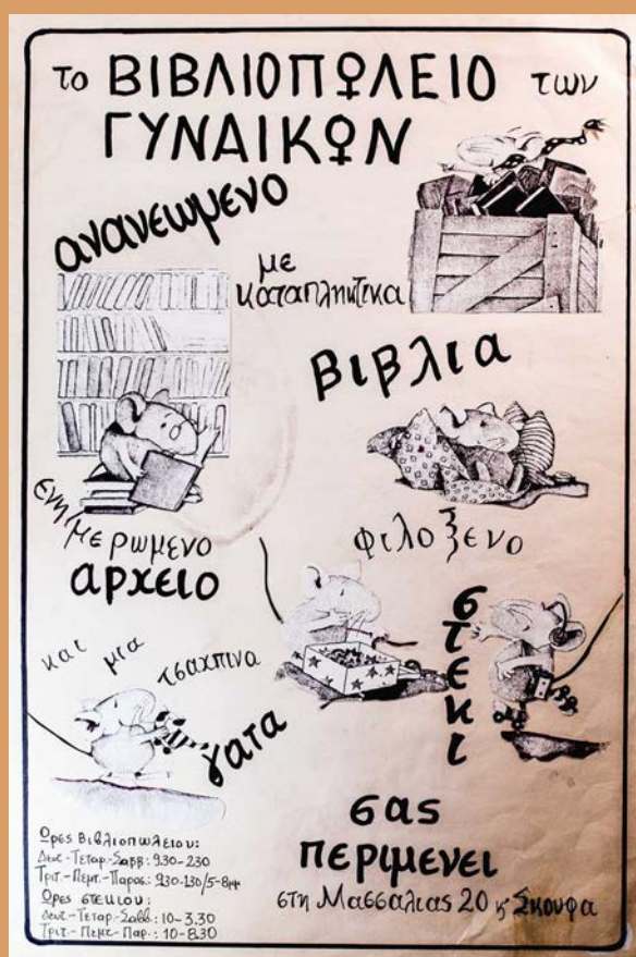
Αφίσα του «Βιβλιοπωλείου των γυναικών» Αρχείο Γυναικών «Δελφύς»