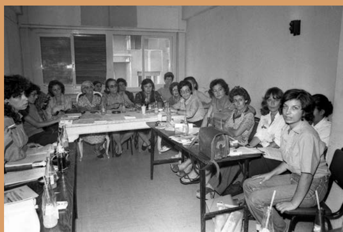
Γυναίκες από την Κίνηση Δημοκρατικών Γυναικών συζητούν...