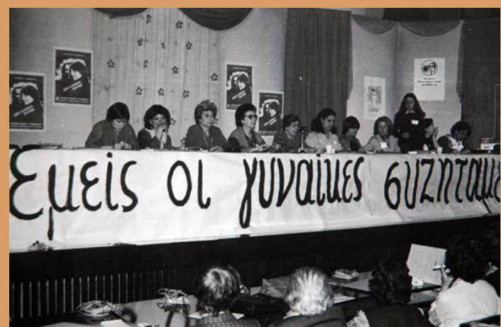
Πρώτο Πανελλαδικό Συνέδριο της Κίνησης Δημοκρατικών Γυναικών. Αθήνα, Πάντειος Σχολή, Μάιος 1982