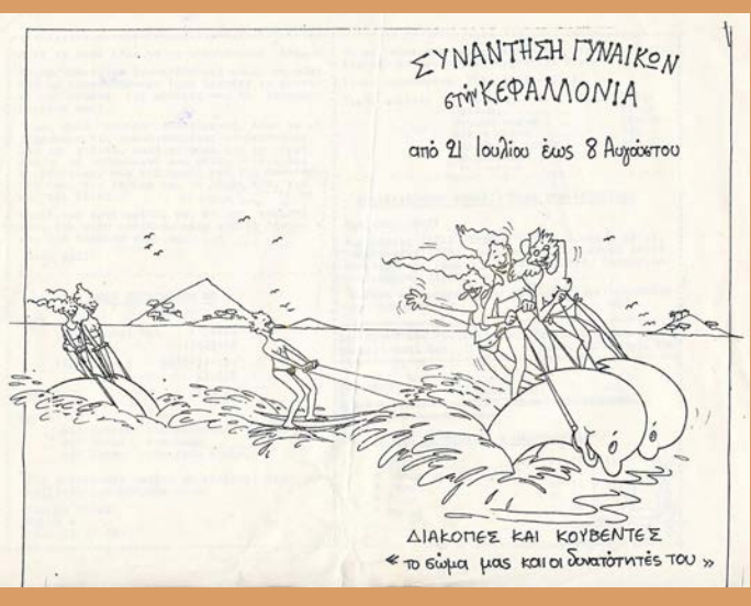
Συνάντηση γυναικών «Διακοπές και Κουβέντες: το σώμα μας και οι δυνατότητές του» στην Κεφαλονιά Αρχείο Γυναικών «Δελφύς»