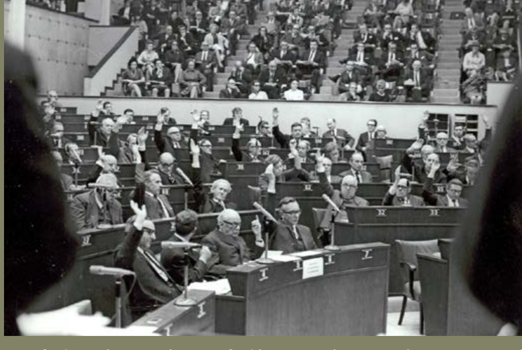
Η Συμβουλευτική Επιτροπή του Συμβουλίου της Ευρώπης εισηγείται την αποπομπή της Ελλάδας. Στρασβούργο, 30 Ιανουαρίου 1969.