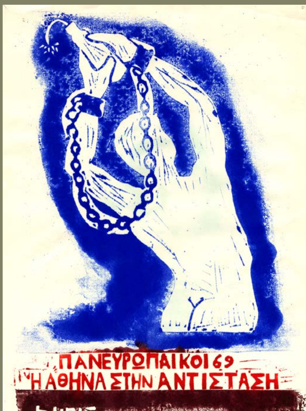
Αφίσα του Ρήγα Φεραίου ενάντια στη διοργάνωση των πανευρωπαϊκών αγώνων στίβου στην Αθήνα. Ε.Λ.ΙΑ.