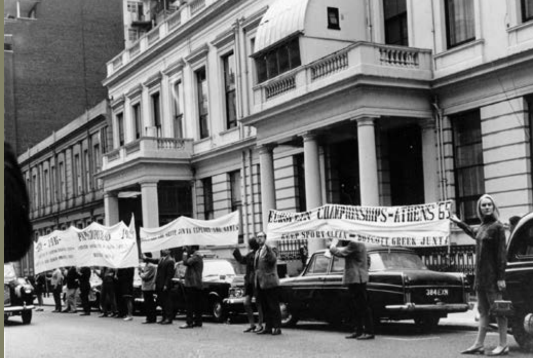
Συγκέντρωση διαμαρτυρίας Αγώνων Στίβου στην Ελλάδα κατά της διαξαγωγής των Πανερωπαϊκών Αγώνων Στίβου στην Ελλάδα, 12 Σεπτεμβρίου 1969.