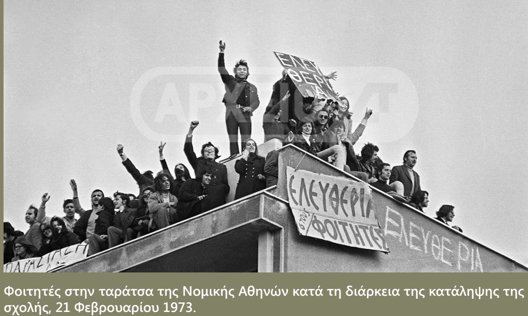
Φοιτητές στην ταράτσα της Νομικής Αθηνών κατά τη διάρκεια της κατάληψης της σχολής 21 Φεβρουαρίου 1973.