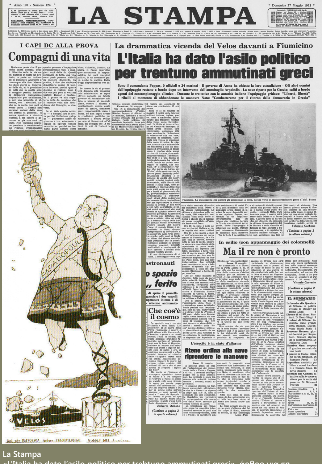
La Stampa «L'Italia ha dato l'asilo politico per trentuno ammutinati greci», άρθρο για τη χορήγηση ασύλου στο πλήρωμα του «Βέλος», εφ. La Stampa, 27 Μαΐου 1973.

Γελοιογραφία από την Παγκόσμια Εκθεση Γελοιογραφίας το 1973