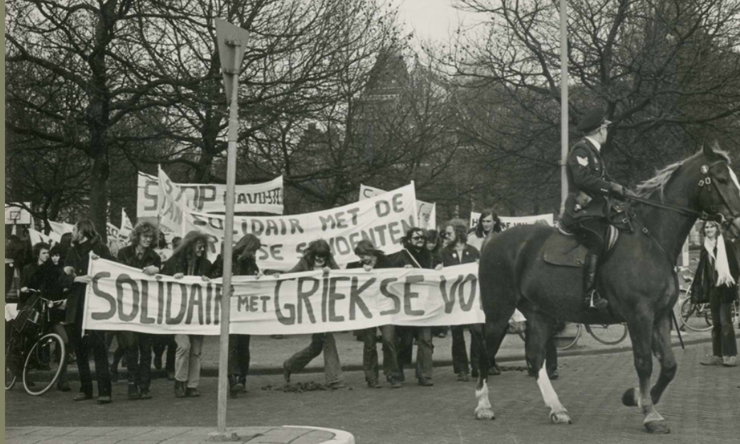
Διαδήλωση κατά της δικτατορίας στο Άμστερνταμ, 31 Μαρτίου 1973.