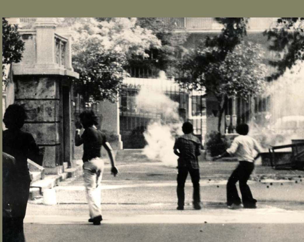
Σκηνή από τα γεγονότα του Πολυτεχνείου, 15-17 Νοεμβρίου 1973.