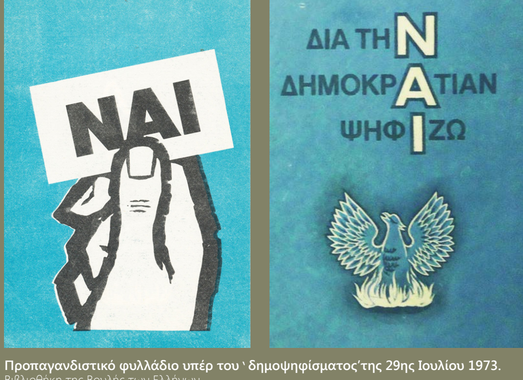
Προπαγανδιστικό φυλλάδιο υπέρ του 'δημοψηφίσματος' της 29ης Ιουλίου 1973. Βιβλιοθήκη της Βουλής των Ελλήνων