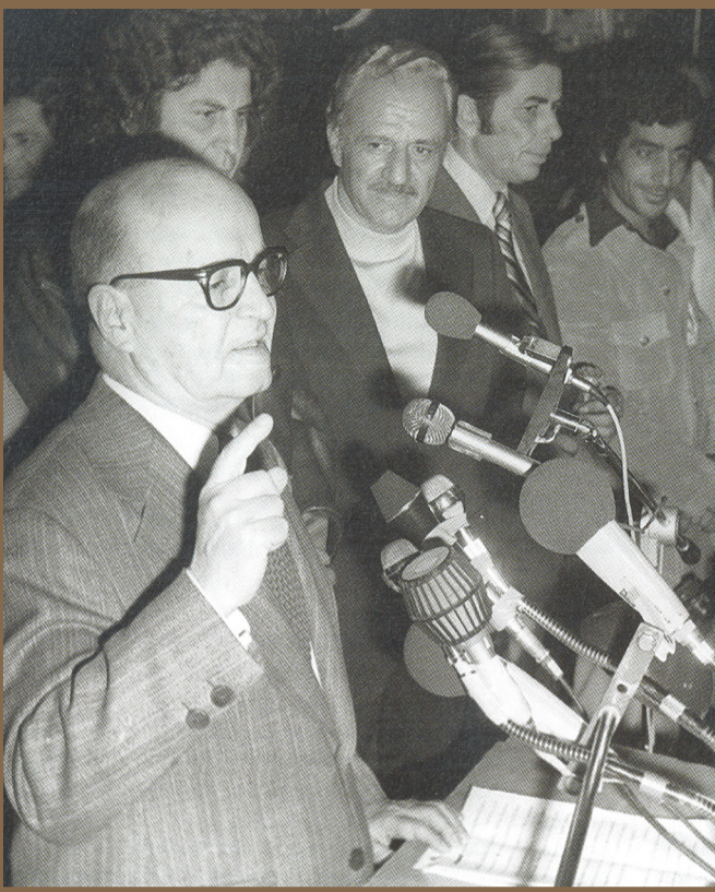
Ο Ηλίας Ηλιού σε προεκλογική συγκέντρωση της Ενωμένης Αριστεράς. Διακρίνονται ο Μίκης Θεοδωράκης και ο Χαρίλαος Φλωράκης

Μετά τη νομοποίηση του ΚΚΕ, ακολούθησαν διεργασίες που οδήγησαν στην προσωρινή ενοποίηση της κομμουνιστικής και μη Αριστεράς. Έτσι, τα δύο κόμματα που είχαν προκύψει από τη διάσπαση του ΚΚΕ τον Φεβρουάριο του 1968, το ΚΚΕ και το ΚΚΕ (εσωτ.), αποτέλεσαν μαζί με την ΕΔΑ την Ενωμένη Αριστερά. Αρχηγοί των τριών κομμάτων ήταν αντίστοιχα οι Χαρίλαος Φλωράκης, Λεωνίδα Κύρκος, και Μπάμπης Δρακόπουλος, και Ηλίας Ηλιού. Ο τελευταίος τέθηκε επικεφαλής της διοικούσας επιτροπής του συνασπισμού. Πάντως, ύστερα από τις εκλογές του Νοεμβρίου του 1974 η Ενωμένη Αριστερά διασπάστηκε.