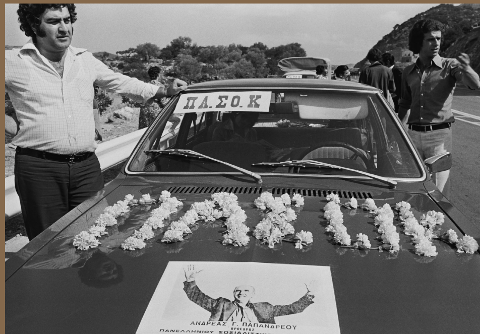
Στιγμιότυπο από την προεκλογική περίοδο