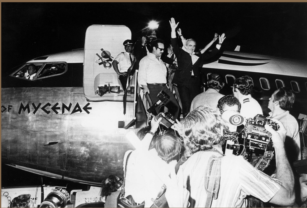
Ο Ανδρέας Παπανδρέου επιστρέφει στην Ελλάδα ύστερα από επτά χρόνια υποχρεωτικής απουσίας και γίνεται δεκτός με ενθουσιασμό από πλήθος πολιτικών φίλων και οπαδών του, 16 Αυγούστου 1974