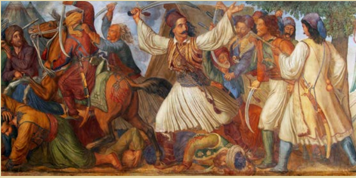
Ludwig Michael von Schwanthaler, Ο Μπότσαρης επιτίθεται στο στρατόπεδο των Τούρκων στο Καρπενήσι , τοιχογραφία Βουλή των Ελλήνων

Μάχη στο Κεφαλόβρυσο της Ευρυτανίας. Θάνατος του Μάρκου Μπότσαρη.