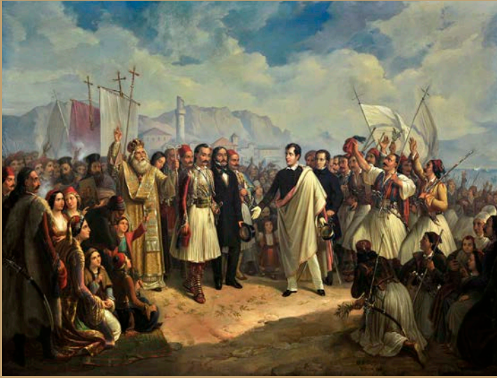
Θεόδωρος Βρυζάκης, Η υποδοχή του Λόρδου Βύρωνα στο Μεσολόγγι , 1861, λάδι σε μουσαμά Δωρεά Πανεπιστημίου, Εθνική Πινακοθήκη – Μουσείο Αλεξάνδρου Σούτζου

Άφιξη, παραμονή και θάνατος του Λόρδου Βύρωνα στο Μεσολόγγι.