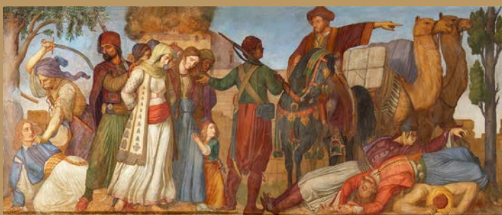
Ludwig Michael von Schwanthaler, Ληλασία της Πελοποννήσου από τον Ιμπραήμ πασά , τοιχογραφία Βουλή των Ελλήνων

Ο Ιμπραήμ λεηλατεί μεγάλο μέρος της Πελοποννήσου.