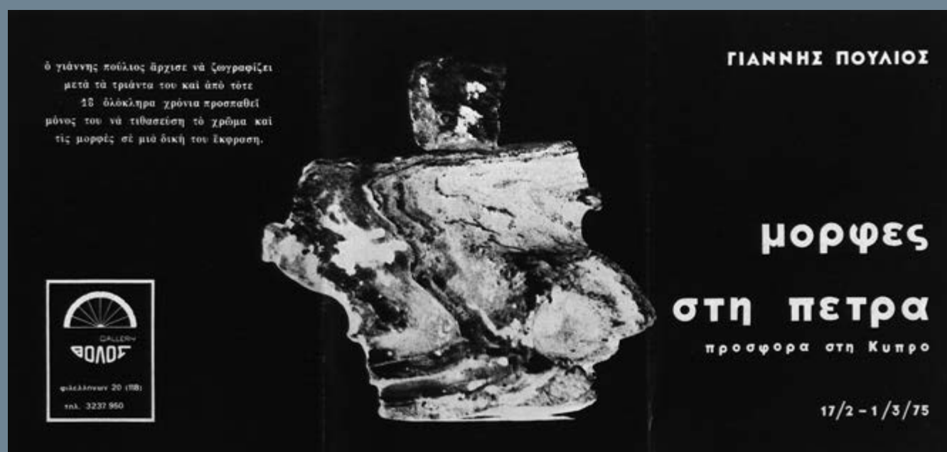
Αφίσα έκθεσης γλυπτικής του Γιάννη Πούλιου Ινστιτούτο Σύγχρονης Ελληνικής Τέχνης