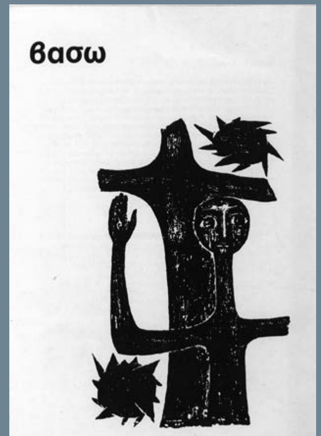
Βάσω Κατράκη Ινστιτούτο Σύγχρονης Ελληνικής Τέχνης