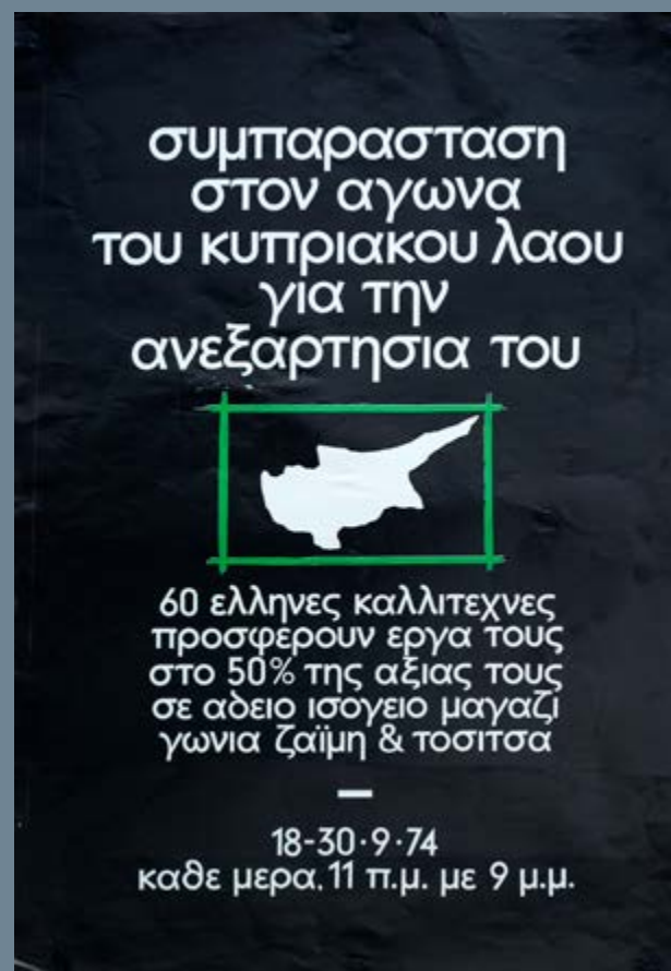
Αφίσα ομαδικής έκθεσης καλλιτεχνών υπέρ του κυπριακού αγώνα Ινστιτούτο Σύγχρονης Ελληνικής Τέχνης