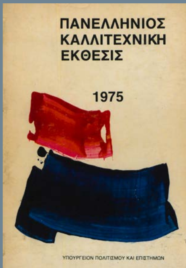
Αφίσα της πρώτης Πανελλήνιας Έκθεσης του Καλλιτεχνικού Επιμελητηρίου Ινστιτούτο Σύγχρονης Ελληνικής Τέχνης